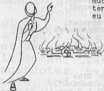
La mujer de Lot. . . miró hacia atrás (19.26)

Recordamos, y seguimos adelante con Jesucristo.