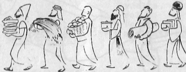
Cada uno llevará sus ofrendas. (16.17)