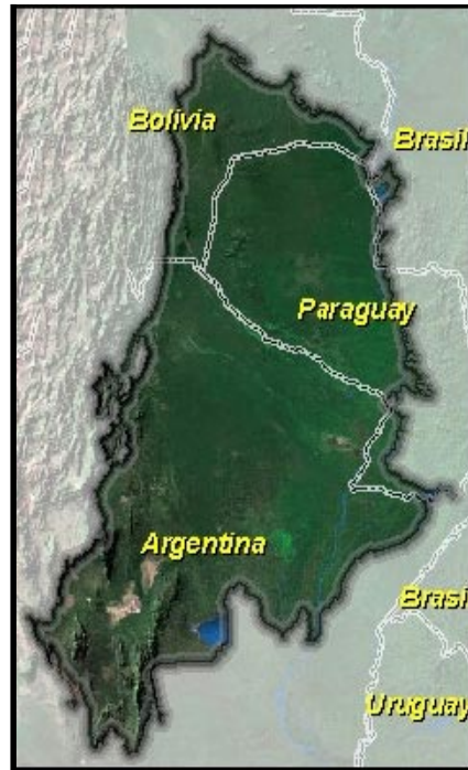
El Gran Chaco Americano

Ya se está conversando en todo la Argentina sobre el Bicentenario, y de lo que pasó hace 200 años en nuestro país cuando se independizo de los reyes de España. Por todas partes se está comentando, escribiendo y charlando sobre este tema en los diarios, las revistas, en las radios y en la televisión. Unos cuentan