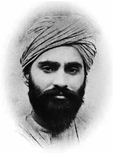
Sadhu Sundar Singh

Mat tej tä noj p'ante lew'atshancheyaj, häp n'amel tä kamaj y'eche fwalasna n'aisej t'at häp SADHU SUNDAR SINGH, lhäy'e t'ekhahyaj tä iwoye, lhäy'e lehumnhayaj tä itiyepjej wichi. Is chik wuj tä n'enlhaticunhayaja, wet n'at'alheje Dios lech'otyaj yämthilek n'aten.